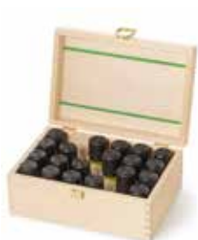
Duftbox für 24 Fläschchen