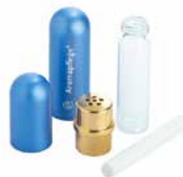
Inhalierstift Glas/Alu in silber, gold, rosé und blau