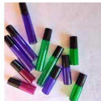
Roll-on farbig, 5 /10 ml