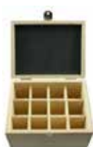
Holzkästchen für 12 Fläschchen