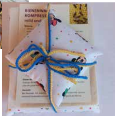
Basisset klein mit Ohrkissen