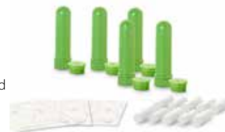
Aromasticks inkl. Vliese und Etiketten