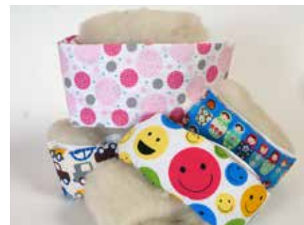
Halswickelset für Kinder/Erwachsene