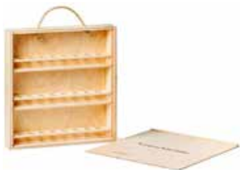
Koffer „small“ für 24 Fläschchen