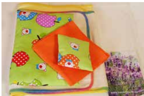
Brust-/Bauchwickelset für Kinder

Viele wertvolle Tipps und Anleitungen zum Wickeln finden Sie auf www.wickel.info